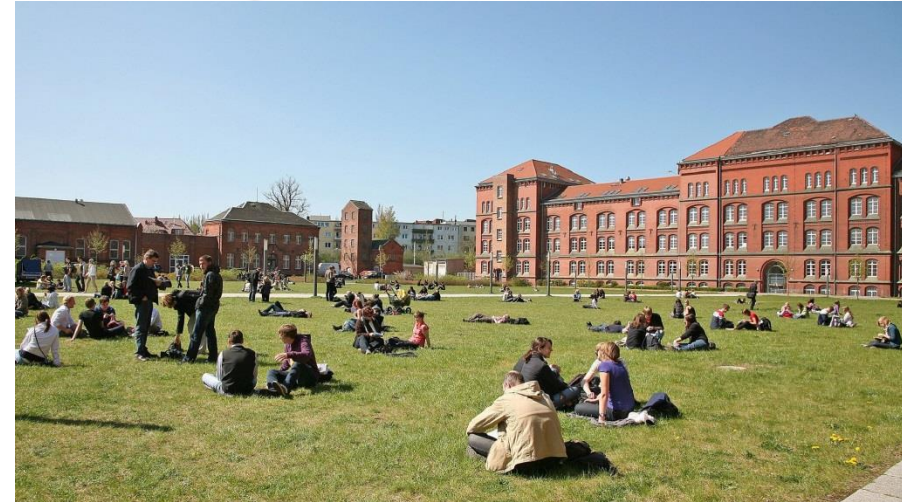
Campus Ulmenstrasse

1419 gegründet = drittälteste Hochschule Deutschlands + älteste Universität im Ostseeraum n = 12.815 Studierende (2024/2025)